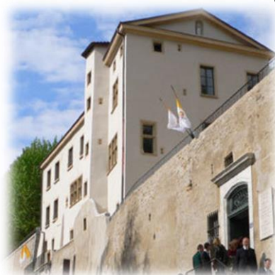
Maison de Pauline Jaricot