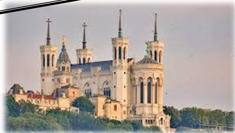
Basilique Notre Dame de Fourvière