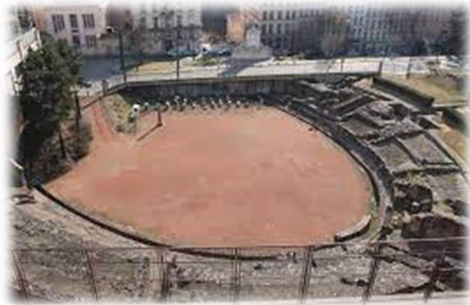
Amphithéâtre des trois Gaules